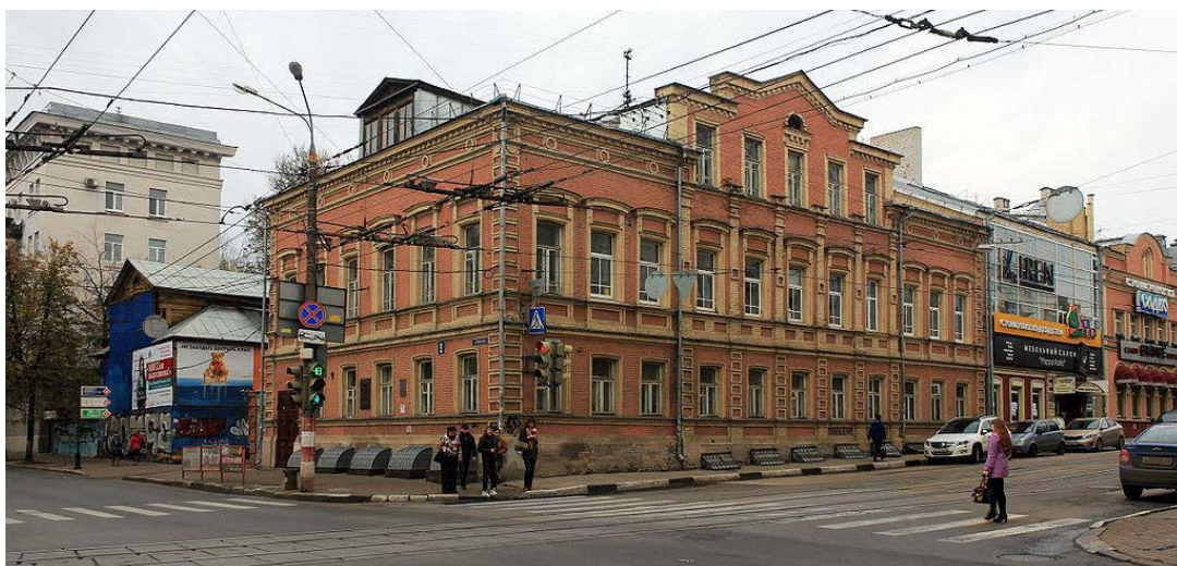
ОКН «Дом, где в 1897-1906 гг. жил и работал фотограф-художник Карелин Андрей Осипович». 2018 г.

В ходе визуального осмотра в апреле 2021 г. было установлено, что конструктивные и архитектурные элементы памятника находятся в удовлетворительном, местами неудовлетворительном состоянии.