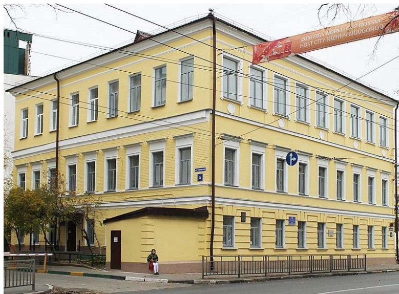
ОКН «Дом, где в 1857-1858 гг. жил поэт Шевченко Тарас Григорьевич». 2019 г.

В ходе визуального осмотра в апреле 2021 г. было установлено, что конструктивные и архитектурные элементы памятника находятся в нормальном состоянии.