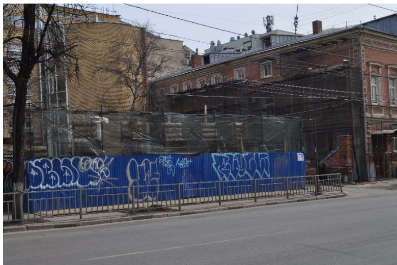
ОКН «Дом М.Ф. Щелокова». Фото 2021 г.

В ходе визуального осмотра проведенного в 2020г. специалистами ООО «Асгард» было установлено, что большинство архитектурных и конструктивных элементов памятника находятся в неудовлетворительном состоянии. Междуэтажное и чердачное перекрытие находится в предаварийном и аварийном состоянии, некоторые конструкции представляют опасность разрушения. Территория объекта культурного наследия пришла полностью в упадок.