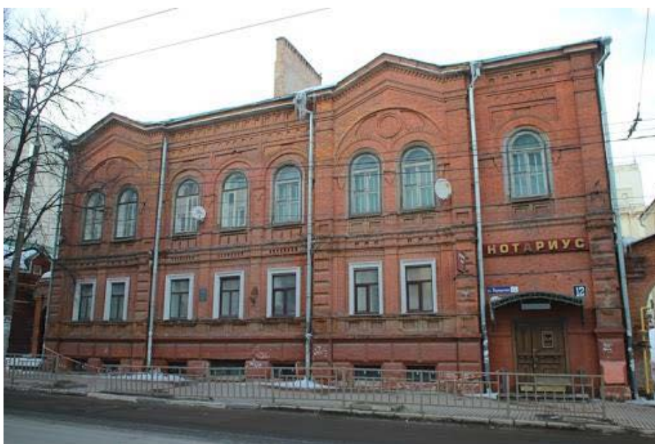
ОКН «Дом пароходного общества «Дружина». 2019 г.

В ходе визуального осмотра в апреле 2021 г. было установлено, что конструктивные и архитектурные элементы памятника находятся в удовлетворительном состоянии.