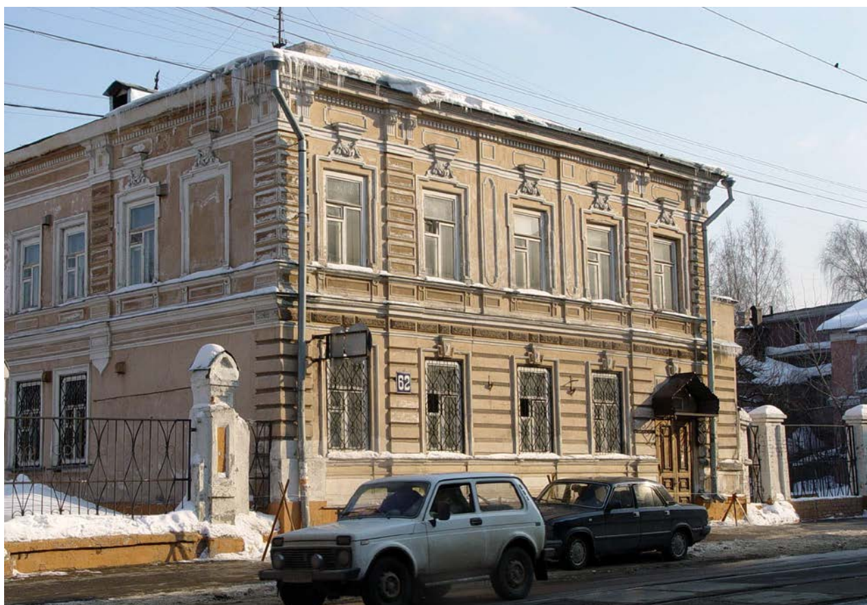
ОКН «Жилой дом» по ул. Ильинской, 62.

Памятник градостроительства и архитектуры регионального значения «Жилой дом» зарегистрирован в Едином государственном реестре объектов культурного наследия (памятников истории и культуры) народов Российской Федерации (далее – Реестр) под номером 521510315040005 по адресу: г. Нижний Новгород, ул. Ильинская, 62 (литер А).