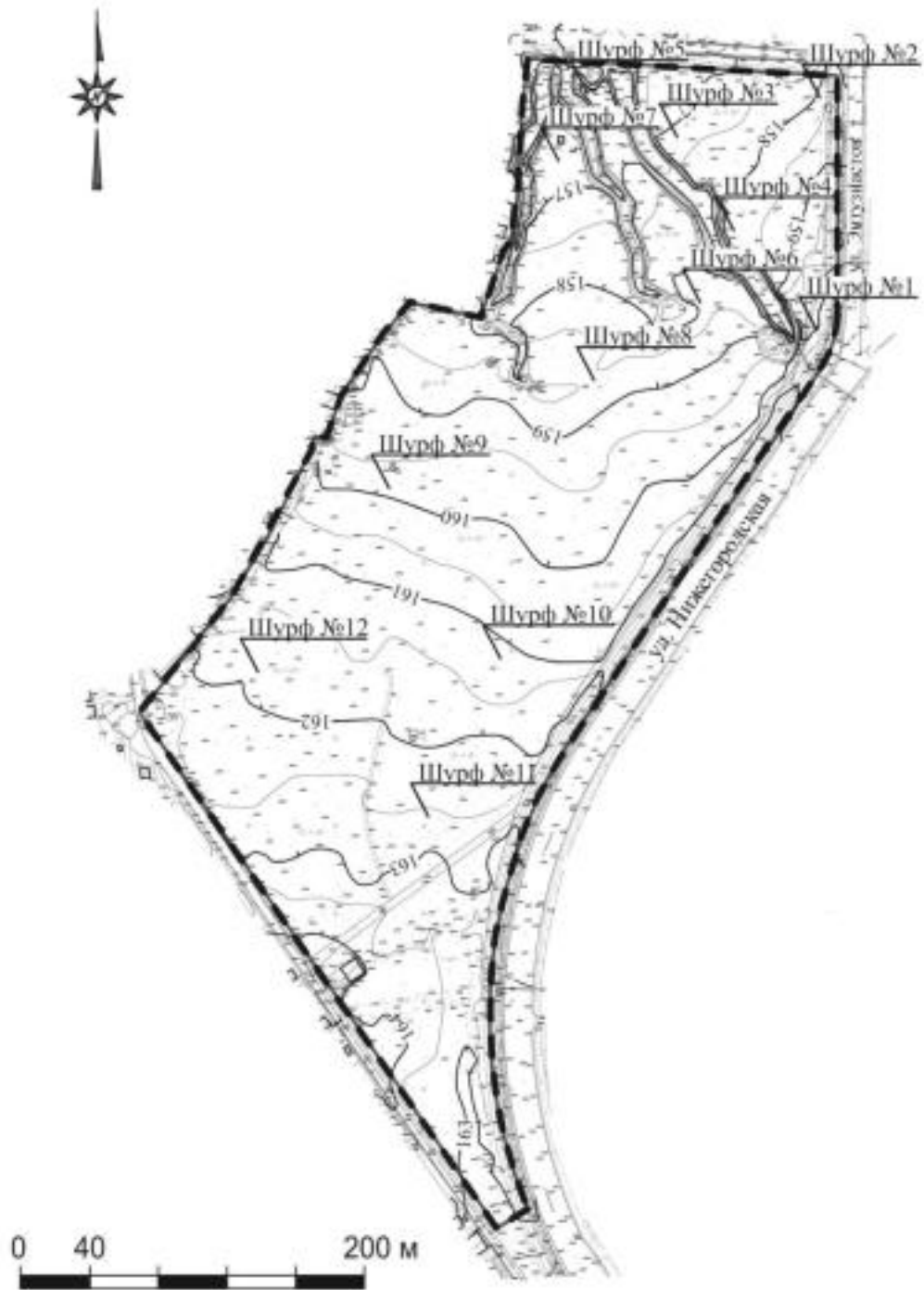
Карта-схема расположения обследуемого земельного участка, с указанием мест закладки шурфов.