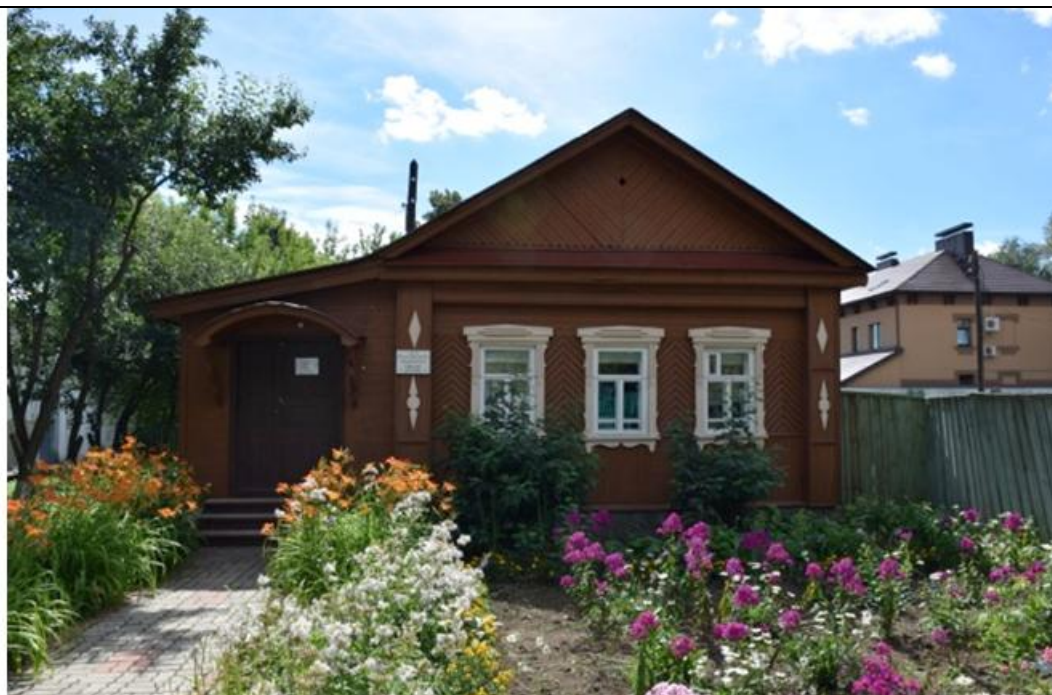
Объект культурного наследия федерального значения «Дом, в котором в 1908 г. по 1918г. Жил детский писатель Аркадий Гайдар (Голиков Аркадий Петрович)»

Фотофиксация объекта культурного наследия федерального значения «Дом, в котором в 1908 г. по 1918 г. жил детский писатель Аркадий Гайдар (Голиков Аркадий Петрович)», расположенного по адресу: Нижегородская область, г. Арзамас, ул.Горького, 22 по состоянию на 2017 год