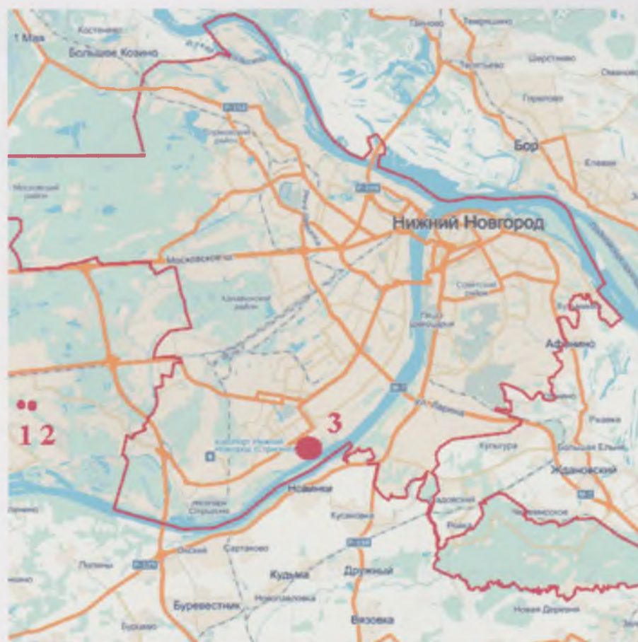
Ил.1а. Карта г. Н. Новгорода с указанием места расположения участка проектируемого строительства (3) и мест расположения ближайших памятников археологии (селище и поселение Нагулинские (1-2)).