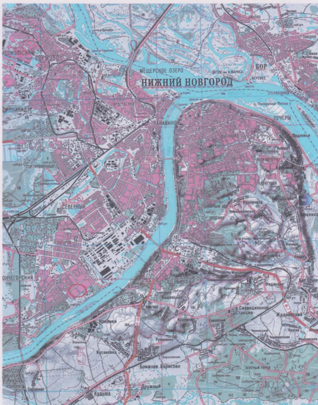
Ил.1. План г. Н. Новгорода с указанием места расположения участка планируемого строительства по адресу: Автозаводский район, ул. 6 микрорайон, д. 33,35,37 (выделено красным цветом).