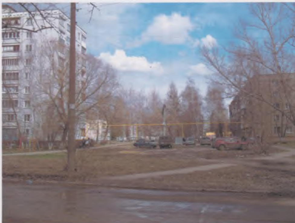
Ил.1а. Участок планируемого строительства по адресу: г. Н. Новгород, Автозаводский район, ул. 6 микрорайон, д. 33,35,37.